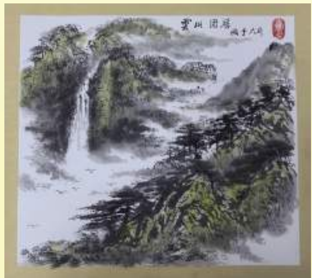
孔宪玉《云山固居》绘画类第三名